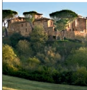
CASTEL MONASTERO, TOSKANA

10 MANDALA SPA & VILLAS, BORACAY Auf der winzigen Badeinsel der Philippinen werden Detox- und Clean-Holidays angeboten. Eine Woche mit Dr. Andersons Superdiät, Colonthérapie etc. kostet ab 1222 Euro im DZ. Tel. 0063/36/288 58 58, www.mandalaspa.com