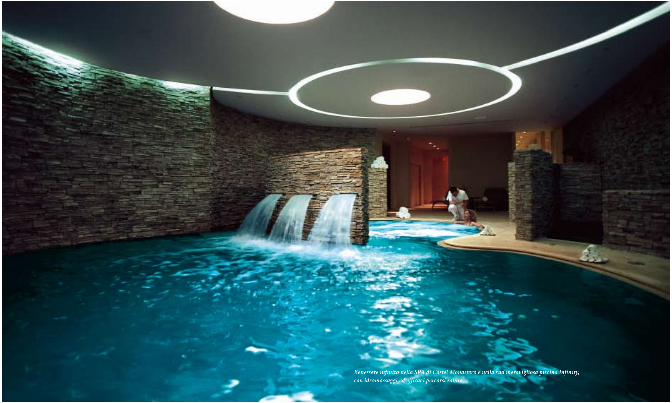
Benessere infinito nella SPA di Castel Monastero e nella sua meravigliosa piscina Infinity, con idromassaggi ed efficaci percorsi salute