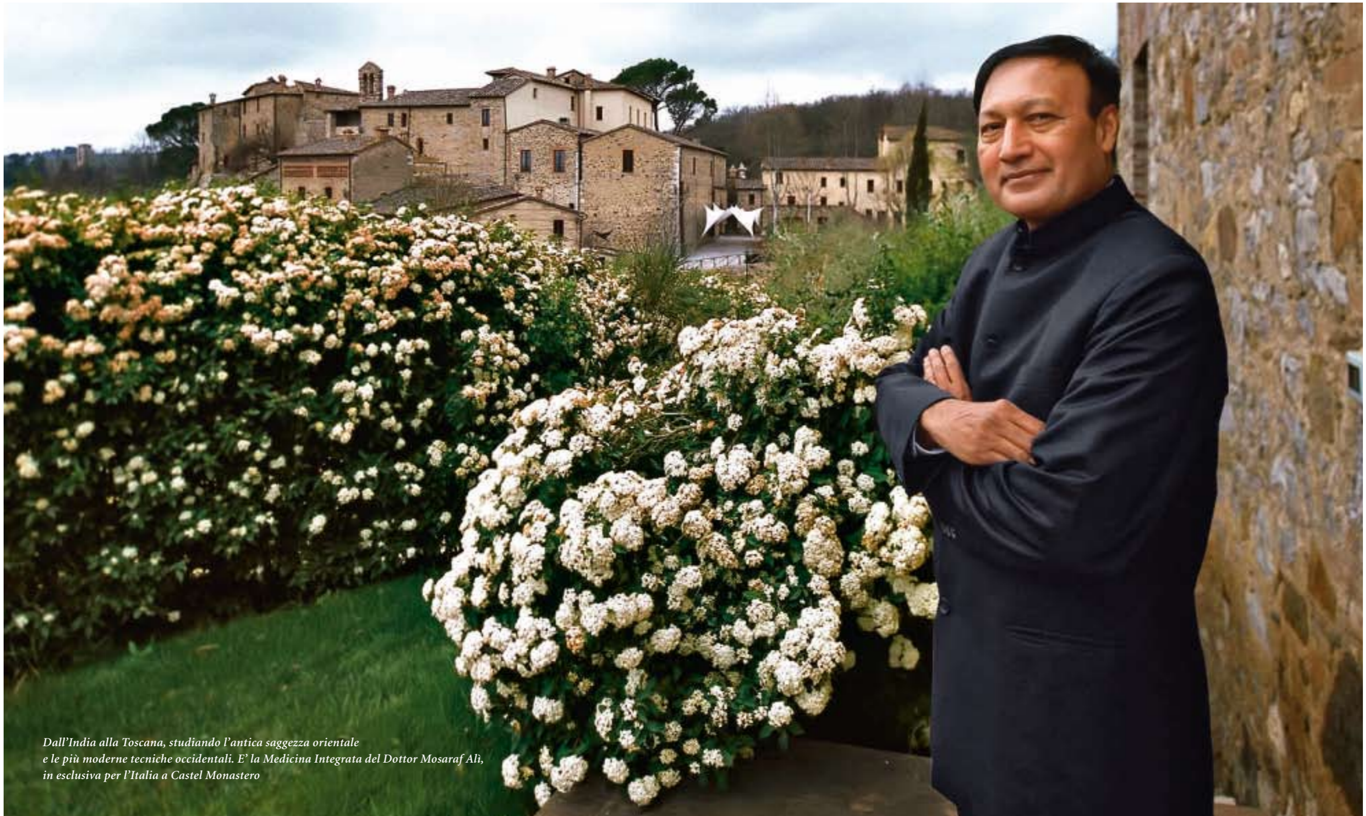
Dall'India alla Toscana, studiando l'antica saggezza orientale e le più moderne tecniche occidentali. E' la Medicina Integrata del Dottor Mosaraf Ali, in esclusiva per l'Italia a Castel Monastero